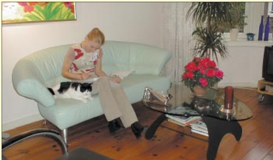
onderzoek in de vertrouwde omgeving