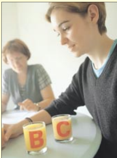
Onderzoek op locatie