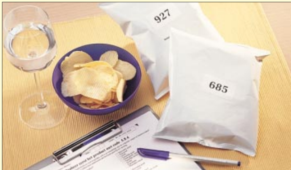
Producten direct vergelijken